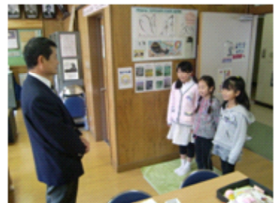
校長室で詩を発表する児童