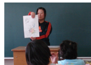
都道府県フラッシュカード