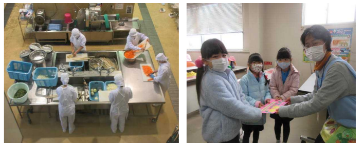
(給食センター訪問の様子)