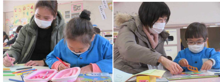
(親子アルバム作りの様子)

★評価の高い項目 ○幼稚園の情報をわかりやすく伝える ◇よくあてはまる100% ○幼稚園内外がきれいに清掃 ◇よくあてはまる(94.7%)